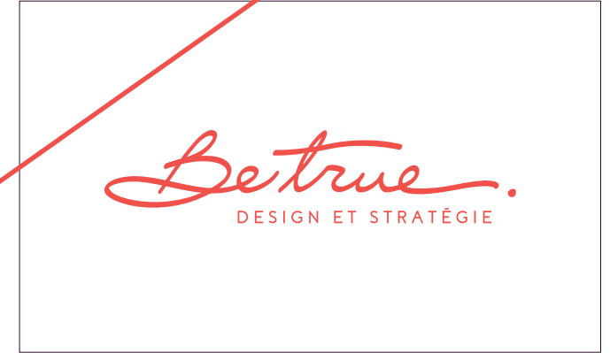
Changement de couleur