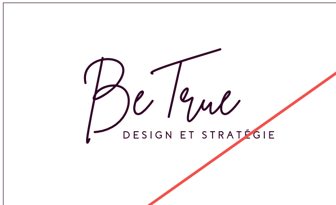
Modifier la police