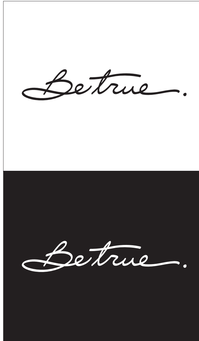
NOIR & BLANC